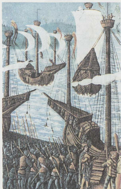
2 Pohod križara (treći križarski rat)

Na Istok su kretali i vitezovi, i seljaci, i građani, pa čak i djeca, koja su najčešće završavala u rukama trgovaca